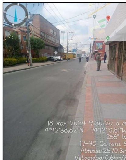
Ilustración 2. Evidencias recorrido